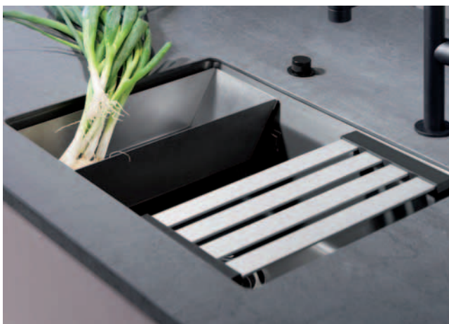
Ebenso passgenau ist eine Edelstahlresteschale als funktionales Accessoire optional erhältlich.