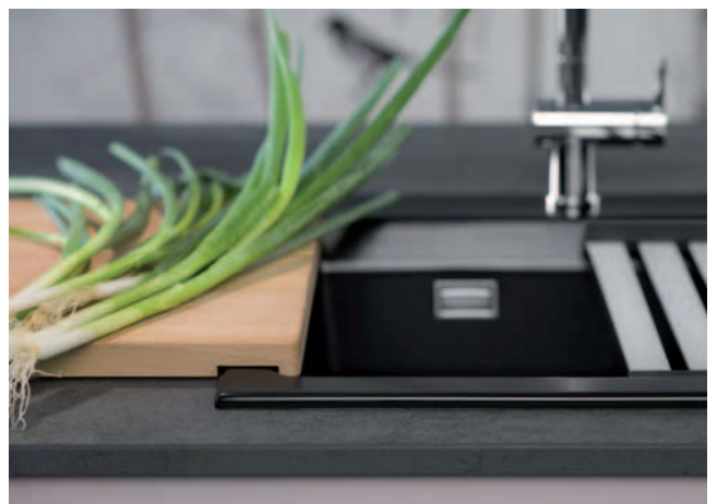
Mit der auf Spülenrandbreite ausgefrästen Aussparung auf der Unterseite lässt sich das Buche-Schneidbrett perfekt für Arbeitsabläufe an der Spüle positionieren.