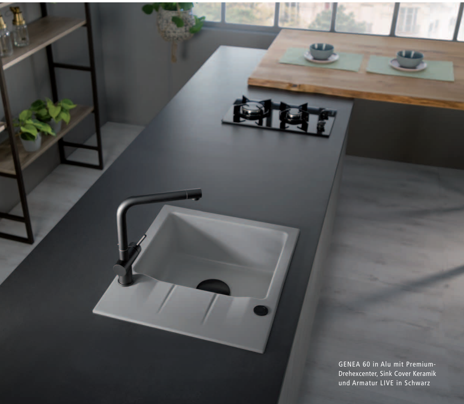
GENEA 60 in Alu mit Premium-Drehexcenter, Sink Cover Keramik und Armatur LIVE in Schwarz

Die neue GENE 60 ist reversibel einsetzbar. Es gibt sie als Einbauspüle und als Spüle für den flächenbündigen Einbau. Bei ausreichend tiefer Arbeitsplatte lässt sie sich um 90° drehen und mit dem Becken vorn einbauen. Alles ist möglich.