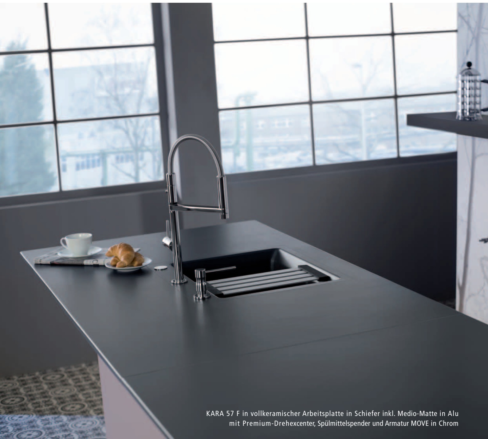
KARA 57 F in vollkeramischer Arbeitsplatte in Schiefer inkl. Medio-Matte in Alu mit Premium-Drehexcenter, Spülmittelspender und Armatur MOVE in Chrom